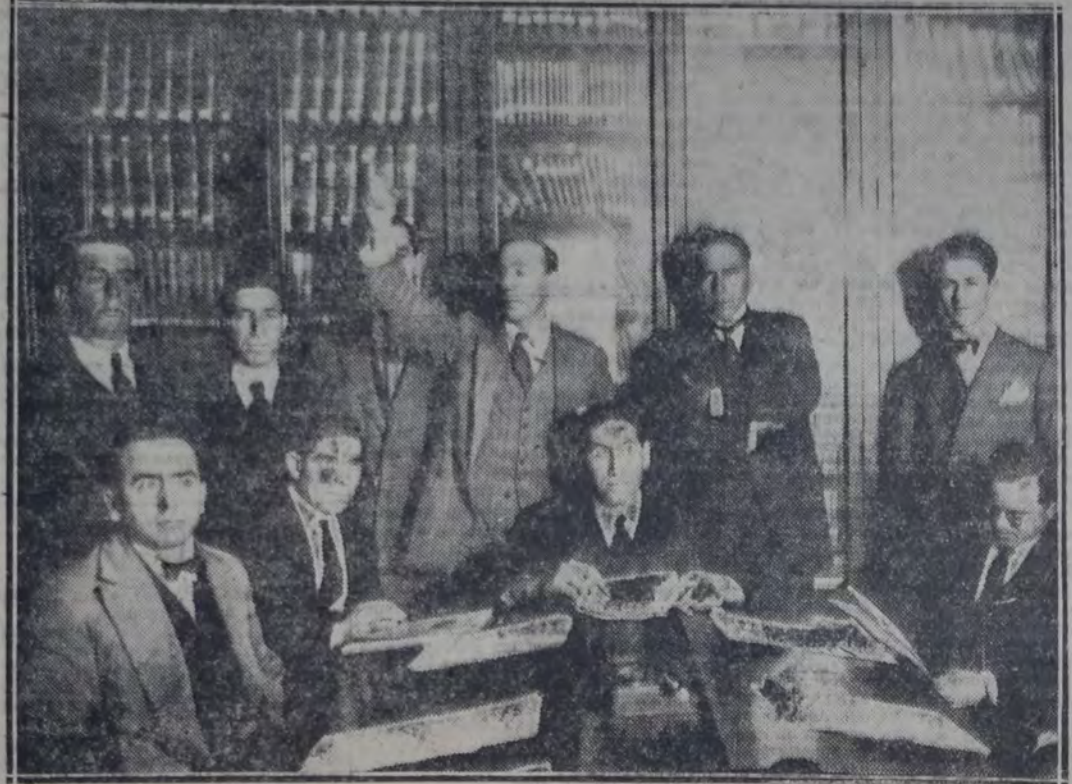
Miembros de la C. A. de la Liga Internacional de Domésticos