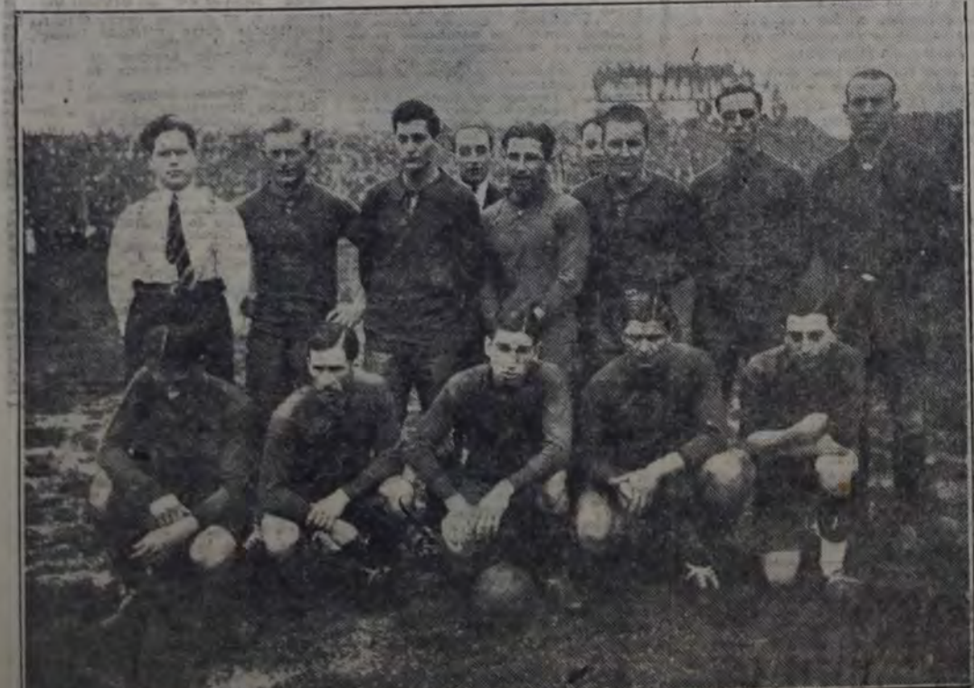
EQUIPO DE LA ASOCIACION AMATEURS ARGENTINA DE FUTBOL "PROVINCIA", CLASIFICADO PARA LA SEGUNDA RUEDA SEMIFINAL DEL CAMPEONATO POR LA COPA "PRESIDENTE DE LA NACION".

Fossa a continuación concede un córner, que tomado por Perinetti, no pro-