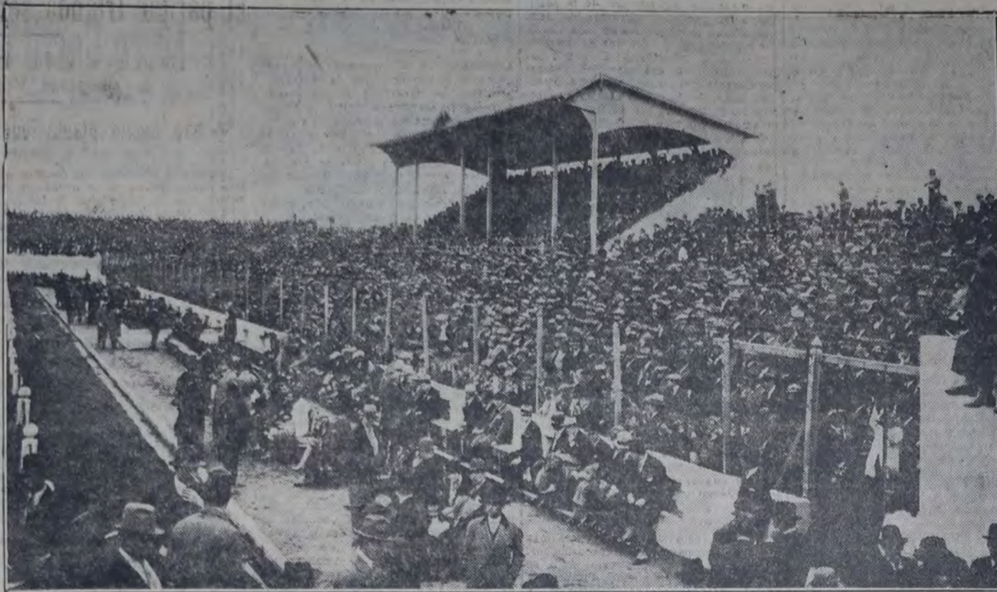
ASPECTO QUE PRESENTABA AYER LA CANCHA DEL CLUB SPORTIVO BARRACAS MUCHO ANTES DE INICIARSE EL PARTIDO ENTRE CAPITAL Y PROVINCIA POR EL CAMPEONATO ARGENTINO

La lucha tuvo dos fases distintas: en el primer período el dominio de Provincia fue evidente, y abrió el score; en el segundo Capital reaccionó y llevó la mejor parte, empatando pero una salida en falso de Muschietti determinó el tanto de ventaja para Provincia. - Total 2 tantos a 1.