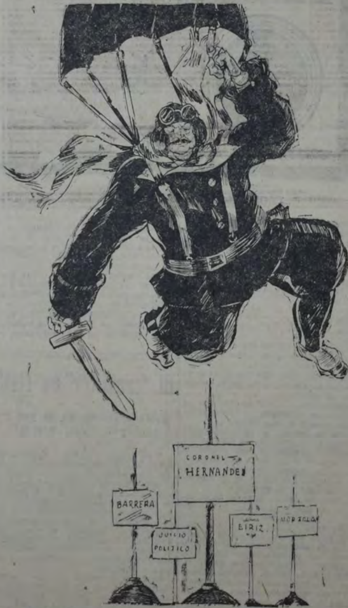
NO HAY PARACAIDAS QUE VALGA PARA EVITAR ESTA CLASE DE ACCIDENTES