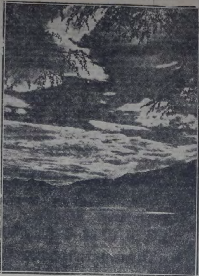
Vista del lago di Como