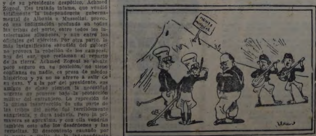
MUSSOLINI. — No está mal; pero para que sea completamente fascista, es necesario pintarlo de negro.