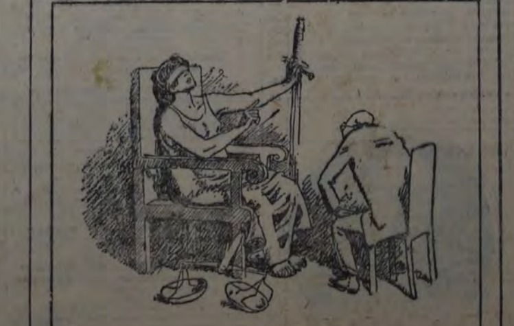
LA JUSTICIA. — Escriba, para que conste ante la Historia que nada me vincula con los hombres que usurpan mi nombre en Massachusetts.