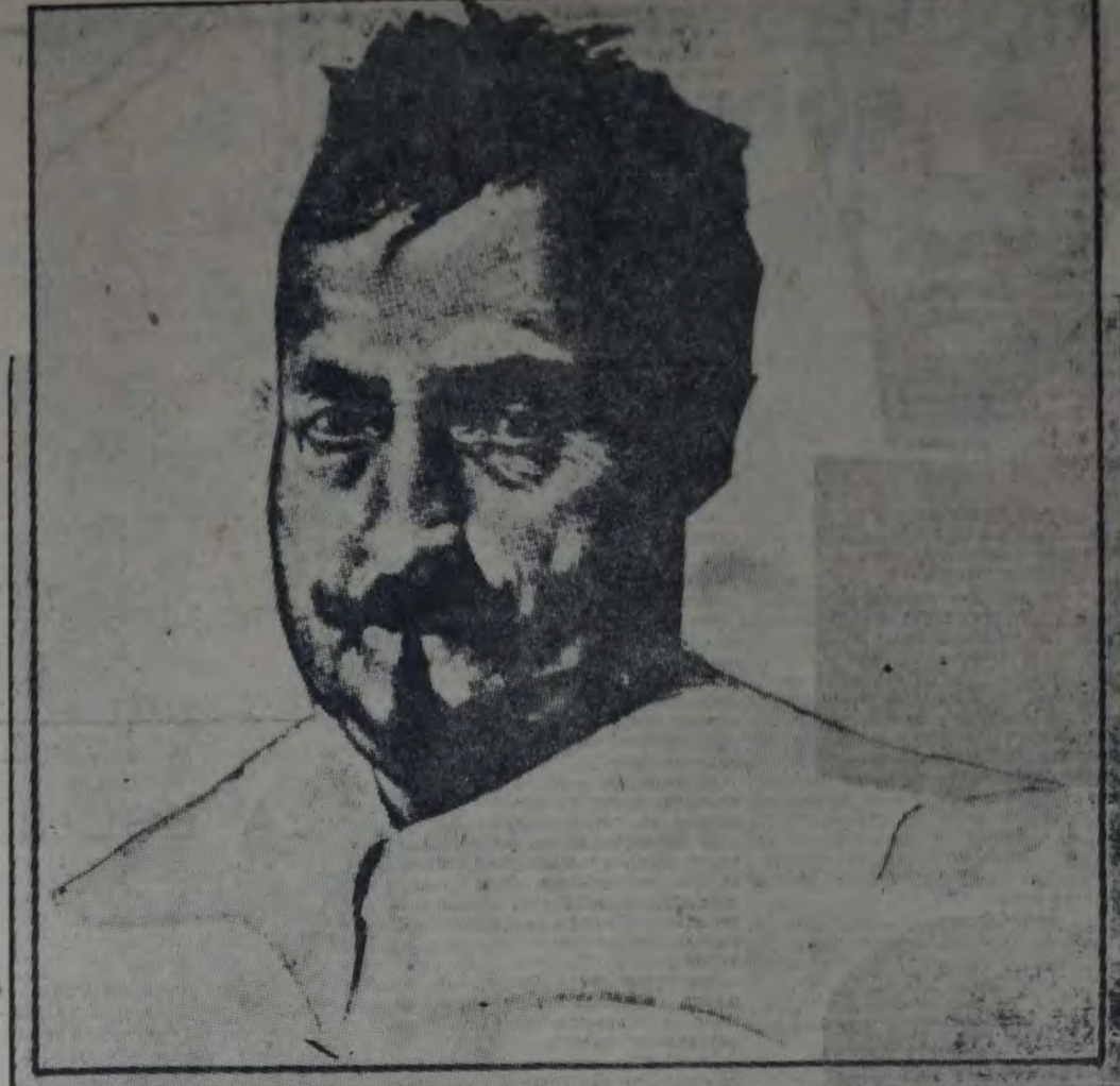
RETRATO DE ZURBARÁN. (Galería Brunswick)

"Mon dieu, mon dieu, la vie est la Simple et tranquille"... Esa vida lleva a todas partes, a condición, naturalmente, de salir de ella. Siempre es así. Salir hacia la gloria y la riqueza, como salieron Picasso, Ubrillo, Dargeles, Carco; salir para llegar a través del bulevar Saint Germain y la "rue" Monge, al cementerio de Ivry. Max Jacob, para ir a enterrarse en el monasterio de St. Benoist sur Loire. Es preciso salir de esa vida, para dejar sitio a los recién llegados que empuja un mismo destino, una misma necesidad de algo nuevo, de aventura trashumante. Es como caminar sobre el abismo marchando sobre una cuerda tensa. ¿Qué importa? Max Jacob publicó cierta vez un cuento en una revista, que comenzaba con estas palabras simbólicas y cabalísticas: "Comme on s'était trompé de route, on dut recommencer l'enterramento".