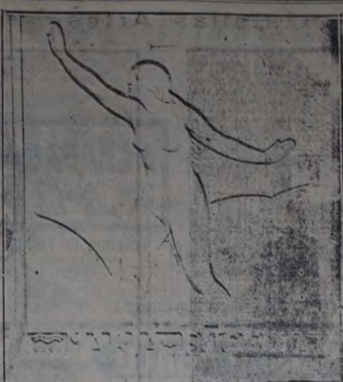
Bajorrelieve L. Falcini.