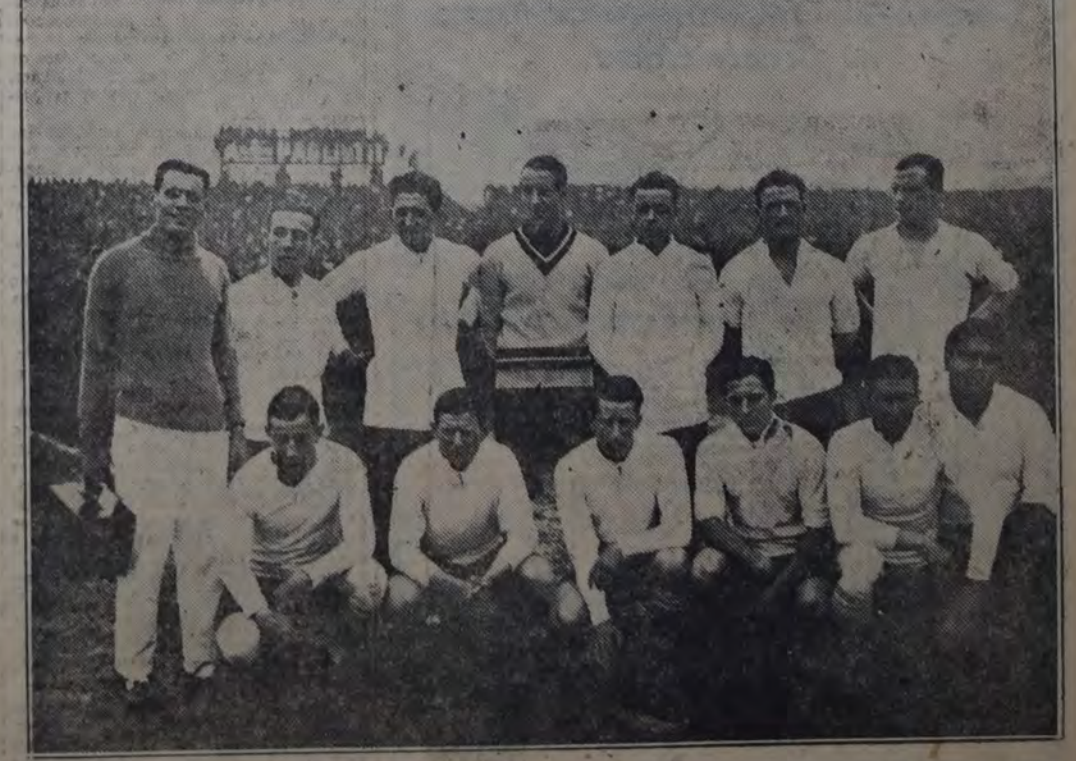
CUADRO "CAPITAL", GANADOR DE LA ZONA No. 1, DEL CAMPEONATO ARGENTINO, QUE FUE ELIMINADO AYER DE ESTE CERTAMEN POR EL EQUIPO "PROVINCIA", DE LA MISMA ENTIDAD QUE AQUEL.